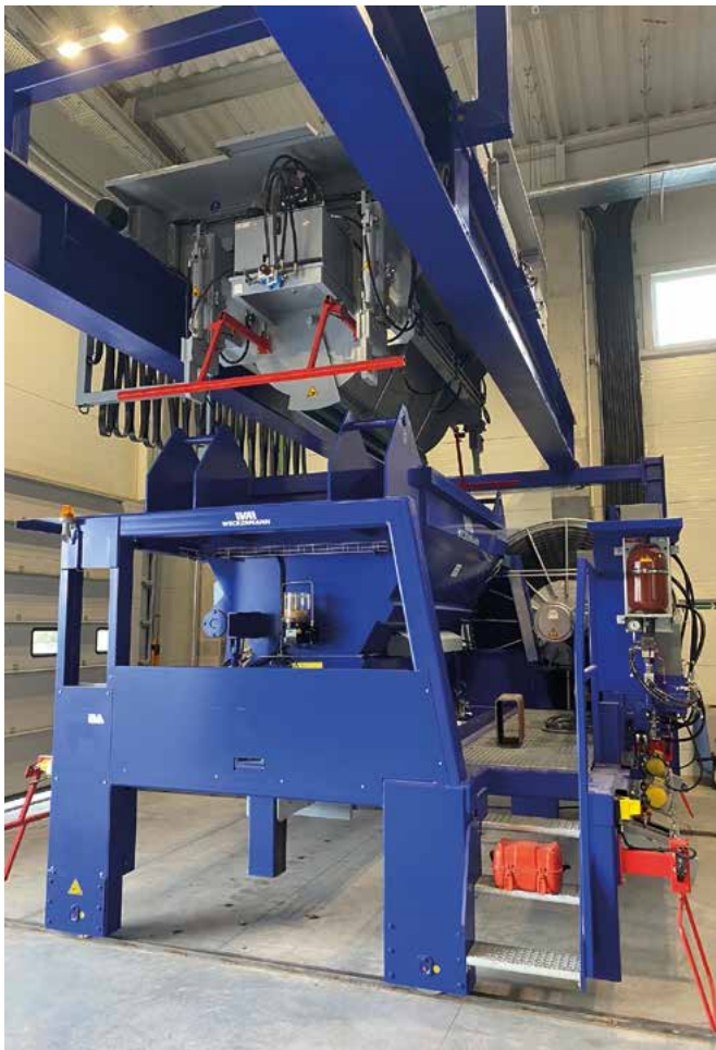
Le tambour de transport de câbles de tension

Weckmann Anlagentechnik GmbH & Co. KG Birkenstraße 1, 72358 Dormettingen, Allemagne T +49 7427 9493-0, F +49 7427 9493-29 info@weckmann.de , www.weckmann.com