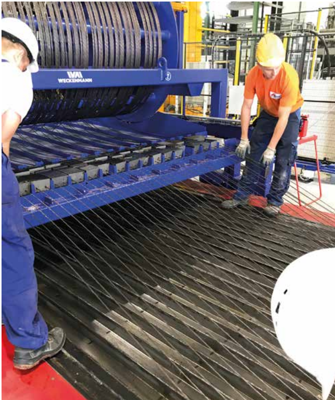
Le distributeur de béton

Avec la deuxième usine de production à Mszczonów près de Varsovie, Rector Pologne peut doubler sa capacité de production de poutrelles précontraintes et élargir son offre avec de nouveaux produits, tels que la production de blocs creux ou de linteaux précontraints. ■